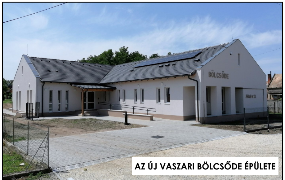
AZ ÚJ VASZARI BÖLCSŐDE ÉPÜLETE

Mindannyiunknak békés, áldott karácsonyt, reménységben, örömben és egészségben gazdag új esztendőt kívánunk a 2022. évre!